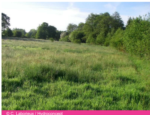
Zone humide située près du cours d'eau le Nançon.

A la demande de la CLE, les quatre syndicats de bassin versant ont démarré leur inventaire de cours d'eau et de zones humides.