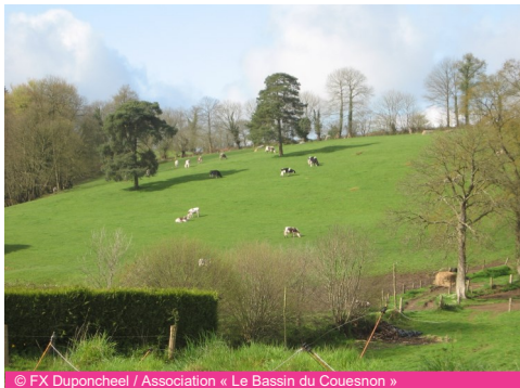
Pâtures près du siège d'exploitation d'Hervé Guérin

Installé depuis 1990 sur la commune du Chatelier, Hervé Guérin élève aujourd'hui 38 vaches laitières, une cinquantaine de génisses et de bœufs sur 60 ha de surface agricole et possède un atelier hors sol de porcs (1200 têtes/an).